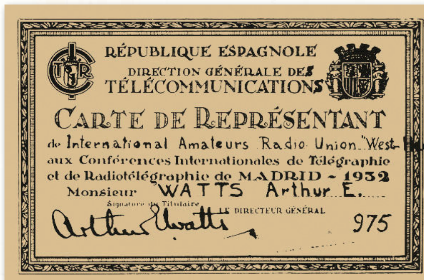
Tarjeta de Representante de la I.A.R.U. en la «Conferencia de Madrid» extendida a G6UN, de la R.S.G.B. (The Bright Sparks of Wireless.- George Jessop, G6JP.- R.S.G.B., 1990) (TNX GW3INW)

Se estudian las condiciones técnicas a exigir a las emisoras. Cuanto menor espacio ocupe una emisión (menor anchura de la banda de frecuencias emitida), mayor número de estaciones pueden montarse. Pero estas instalaciones son costosísimas y exigirían una renovación casi constante del material, lo que si en cierto modo favorecería a la industria disminuiría el problema mundial del paro;