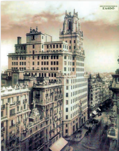
Edificio de la Compañía Telefónica tras su inauguración en 1929, junto al Teatro Fontalba, en la hoy Gran Vía madrileña

■ Los participantes tuvieron programada la visita al que fue primer "rascacielos" de Madrid, el nuevo edificio de la Compañía Telefónica, [...], con casi una veintena de pisos y un centenar de metros de altura