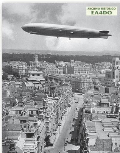
El «Graf Zeppelin» visto desde el edificio de la Telefónica a su paso por Madrid en 1930

■ Los participantes tuvieron programada la visita al que fue primer "rascacielos" de Madrid, el nuevo edificio de la Compañía Telefónica, [...], con casi una veintena de pisos y un centenar de metros de altura