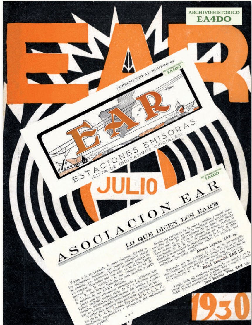
Cubierta de la revista EAR de julio de 1930 con dos recortes del suplemento que se incluyó al final.