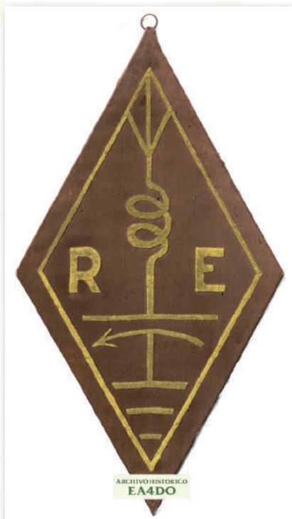
Rombo identificativo de la nueva asociación "Red Española"

El "Boletín da R.E.P.", órgano oficial de