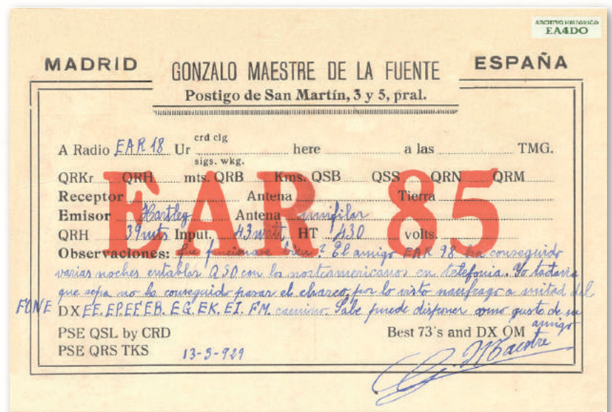
Tarjeta QSL de Gonzalo Maestre, EAR-85, remitida a su buen amigo Javier, EAR-18, con fecha 13 de marzo de 1929