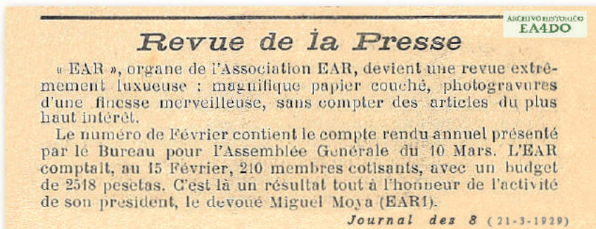
Información incluida en la edición de Journal des 8 de 21 de marzo de 1929 haciendo referencia a la nueva presentación del órgano oficial de la Asociación E.A.R., y también a su asamblea general celebrada el anterior 10 de marzo. (Colección EAR-18/EA1AB)