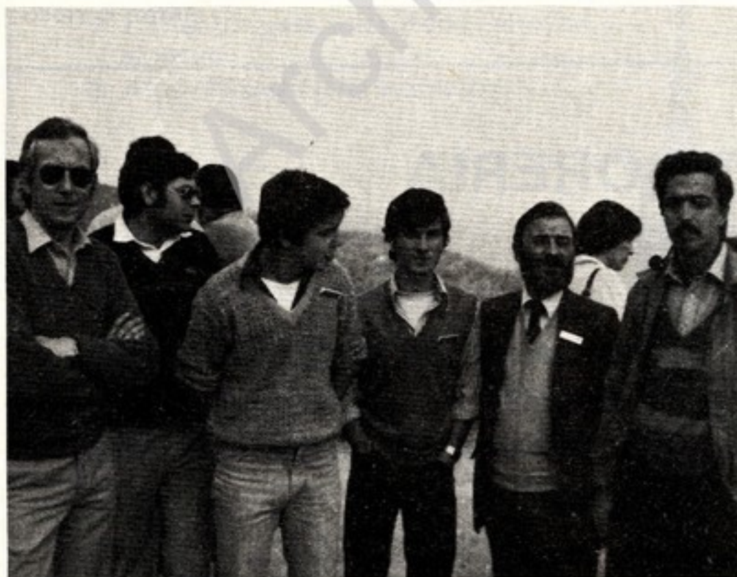
De izquierda a derecha: EA5E2, EA5XO, EC5ND, EC5ND, EA5XN y EA5BRG, componentes del «Orange DX Group».

Para conocer algunos pormenores del recién nacido vamos a conversar seguidamente con su presidente, EA5EZ.