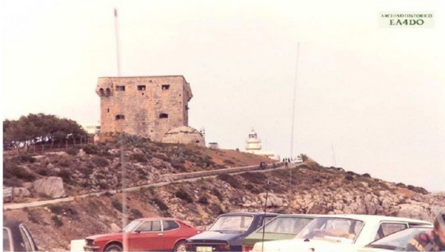
Benicasim 1 de mayo de 1981