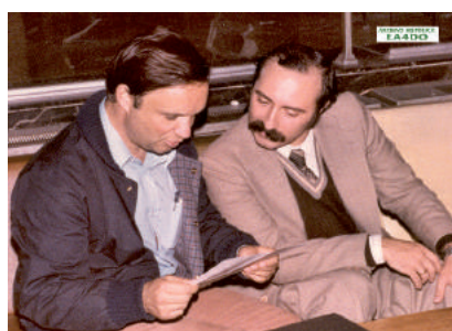
El vocal de información del IDXC en el aeropuerto de Barajas comentando con Fernando, EA8CR 2º op., sus impresiones de la expedición a Guinea Ecuatorial, de la que regresaba tras haber operado la estación 3C1AA en 1979

entrevista realizada a los amigos del México DX Club que habían regresado de una expedición a las islas de Revillagigedo. Dada la gran relación que se fue estableciendo entre nuestros dos clubes, tiempo después creamos el Diploma XE-EA a fin de fomentar las comunicaciones con todos los distritos de España y México.