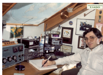
EA4DO, secretario del IDXC dirigiendo el "Iberia Net" en 80 metros, uno de los viernes de 1979 tras finalizar la programación de TVE

de reportajes que se publicaron destacando el de junio de 1980, que llevó en las dos únicas páginas a color de la revista la primera entrevista que se hizo al entonces Rey de España, EA0JC, tras haber comenizado pocos meses antes su actividad en las bandas de frecuencias destinadas al servicio de aficionados.